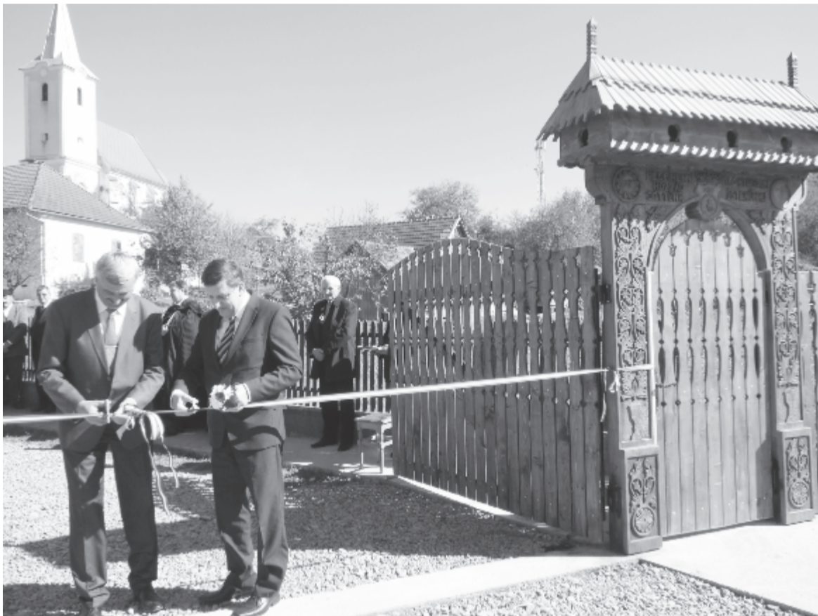
A székely kapu az örökség megőrzésének és a helyhez való ragaszkodásnak a jelképe is