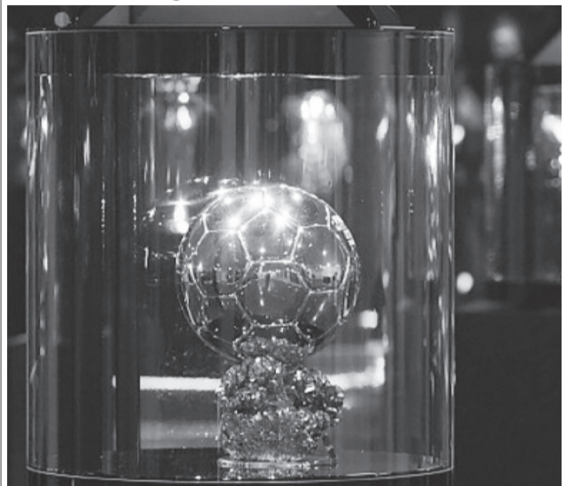
A France Football 2016 óta ismét nem a FIFA-val együttműködve, hanem az 1956 és 2009 között megszokotthoz hasonlóan, azaz önállóan itéli oda az év legjobbjának az Aranylabdát

Nyolc Real Madrid-játékos, valamint a nyáron a spanyol csapatból a Juventushoz szerződött Cristiano Ronaldo is szerepel az Aranylabdajelöltek harmincfős listáján, amelyet hétfőn hozott nyilvánosságra a díjat átadó France Football című magazin.