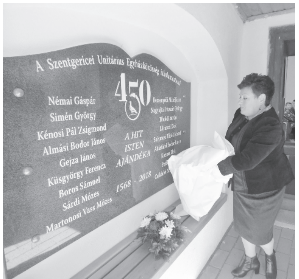
A templom portikusában emléktábla őrzi a volt lelkészek és tanítók nevét