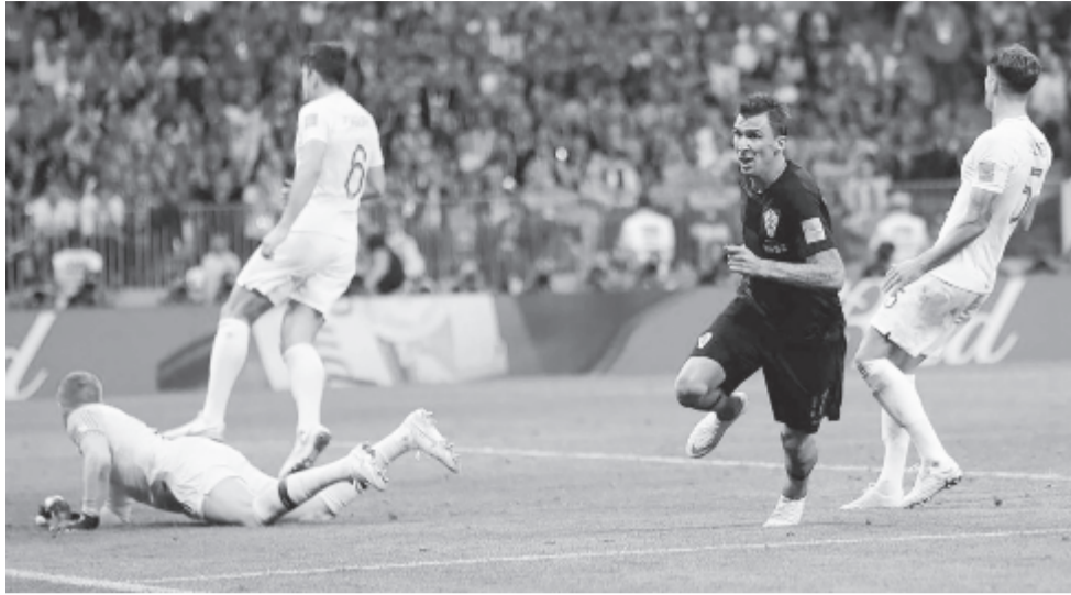
Az egyik legnagyobb érdeklődéssel várt találkozó a legutóbbi vb horvát-angol elődöntőjének a „megisméltése” lesz. A képen Mario Mandzukic (j2) csapata második gólját ünnepli, amely a horvátok döntőbe jutását jelentette

Az egyik legnagyobb érdeklődéssel várt találkozó a nyári, oroszországi világbajnokság egyik elődöntőjének „megisméltése” lesz: a végül negyedik angolok az